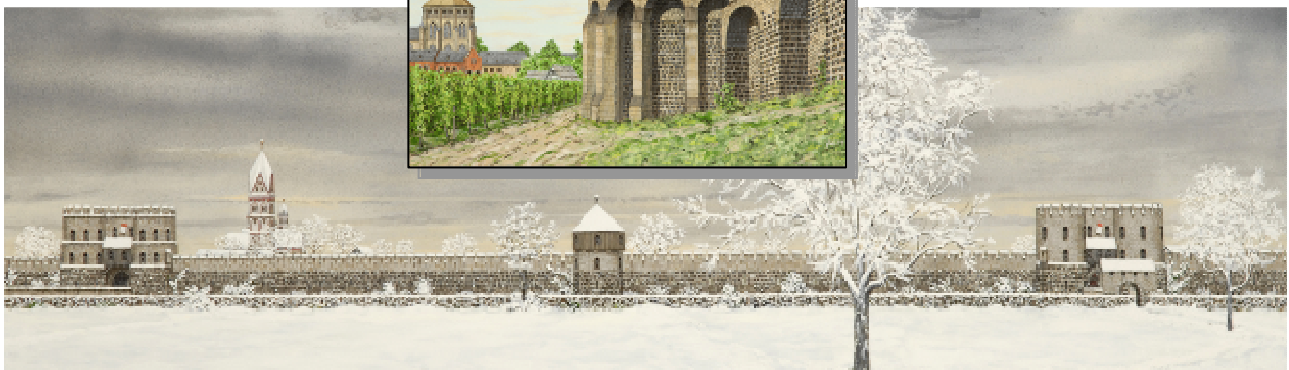
Abbildung nach einem Gemälde von Siegfried Glos www.das-alte-koeln.de Vortrag 15:00 Uhr Turm der Prinzengarde