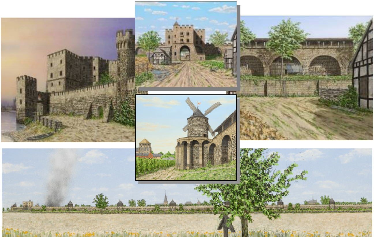
Abbildung nach einem Gemälde von Siegfried Glos www.das-alte-koeln.de Vortrag 15:00 Uhr Turm der Prinzengarde